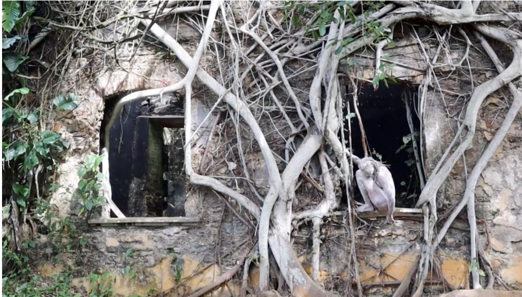
Lisa C Soto, "Yo, como la gameleira", 2023, Film, 4 Min., 42 Sec. © Lisa C Soto